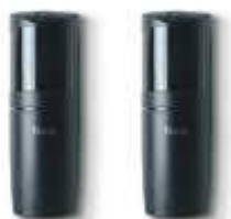
F210B fotokomórki (para) BLUEBUS, nastawne z kątem 210°, zasięg 15 m