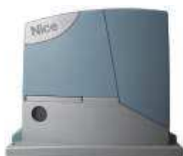
ROBUS350 siłownik z wbudowaną centralą sterującą BLUEBUS