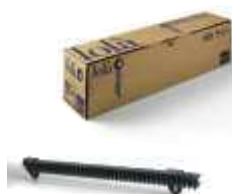
LOLA listwa zębata nylonowa M4, w odcinkach po 0,5 metra, pakowana po 10 sztuk, cena za 5 mb