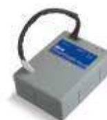
PS124 akumulator 24V 1.2 Ah z wbudowaną kartą ładowania