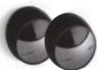
MOFB fotokomórki (para) BLUEBUS zasięg 15-30 m